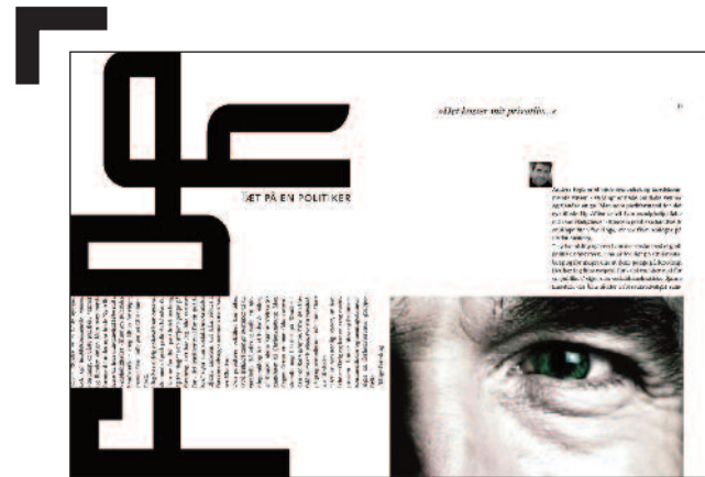
Design: Anne-Marie Krogh