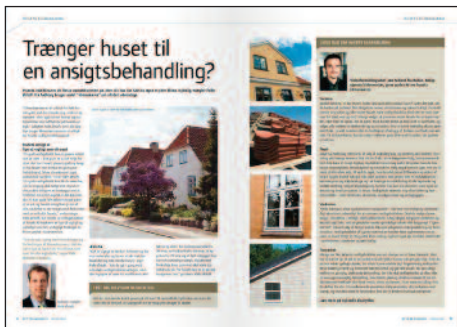
Nykredit – magasin for boligejere

Et lille udvalg af danske magasiner og tidsskrifter. Læg mærke til den manglende designmæssige forskel på de to typer periodica. Hvorfor skal danske magasiner og tidsskrifter have samme, eller næsten samme visuelle udtryk, når de henvender sig til forskellige målgrupper?