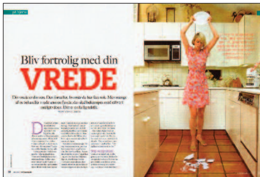
Nova – til kvinder der ikke er født i går