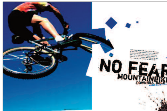
Design: Runi Hansen