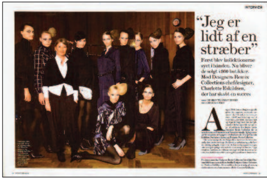
Costume – på forkant med de nyeste tendenser ser fra catwalken i New York, London, Milano og Paris!