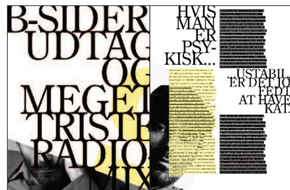
Design: Kristian Stangerup

I min undervisning i magasin-design på Den Grafiske Højskole lægger jeg op til at den studerende får mulighed for at bryde grænser indenfor visuel historiefortælling og det visuelle formsprog. Deres opgave er visuelt at udfordre læseren.